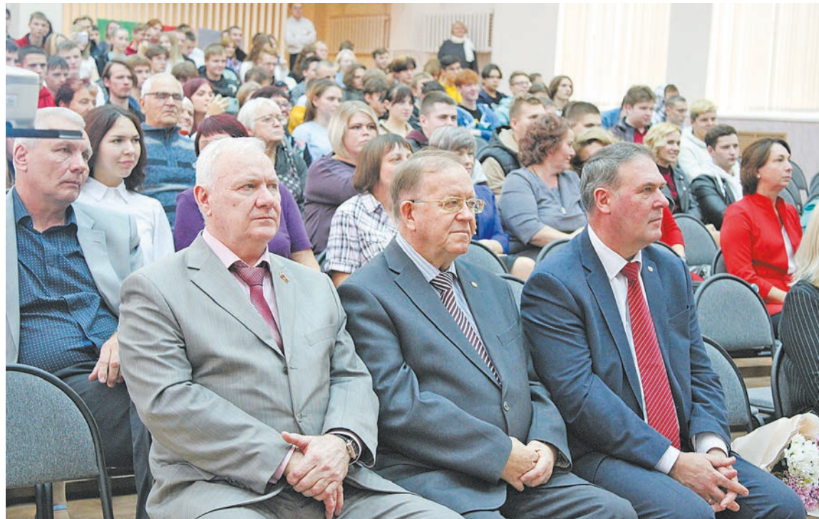
В актовом зале собрались студенты, учителя, ветераны, выпускники, почетные гости

Новый этап жизни учреждения начался в середине 90-х годов прошлого столетия. К этому времени его переименовали в техникум