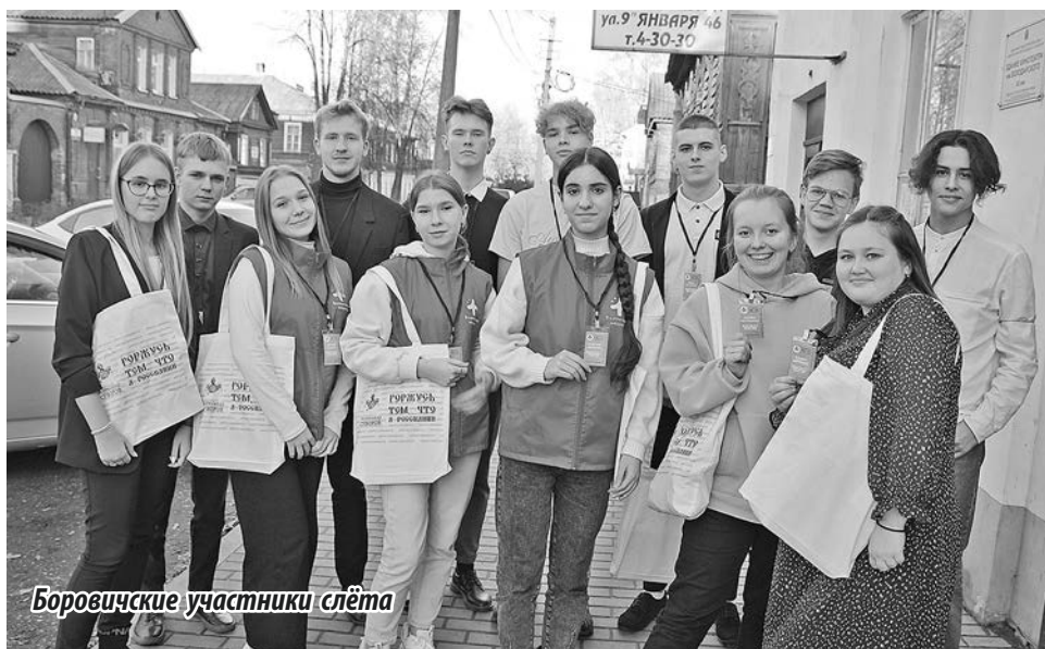
Боровичские участники слёта

Завершился слёт акцией «Огненные картины». Её провели у памятной стелы «Боровичи – город трудовой доблести». Молодые патриоты делились впечатлениями о прошедшем учебном дне, благодарили организаторов. В половине восьмого вечера было уже темно, на чёрном бархате неба выглянули звёзды. Юноши и девушки зажгли свечи в лампадах, поставили их у подножия стелы и выстроили фразу с хештегом #Яроссиянин. Огни ярко горели и согревали сердца.